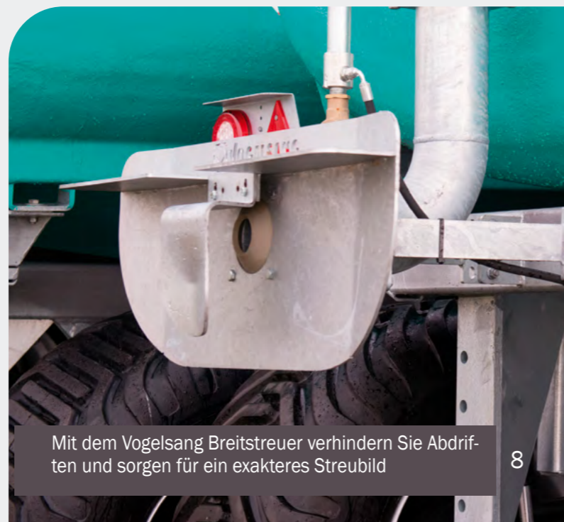
Mit dem Vogelsang Breitstreuer verhindern Sie Abdriften und sorgen für ein exakteres Streubild