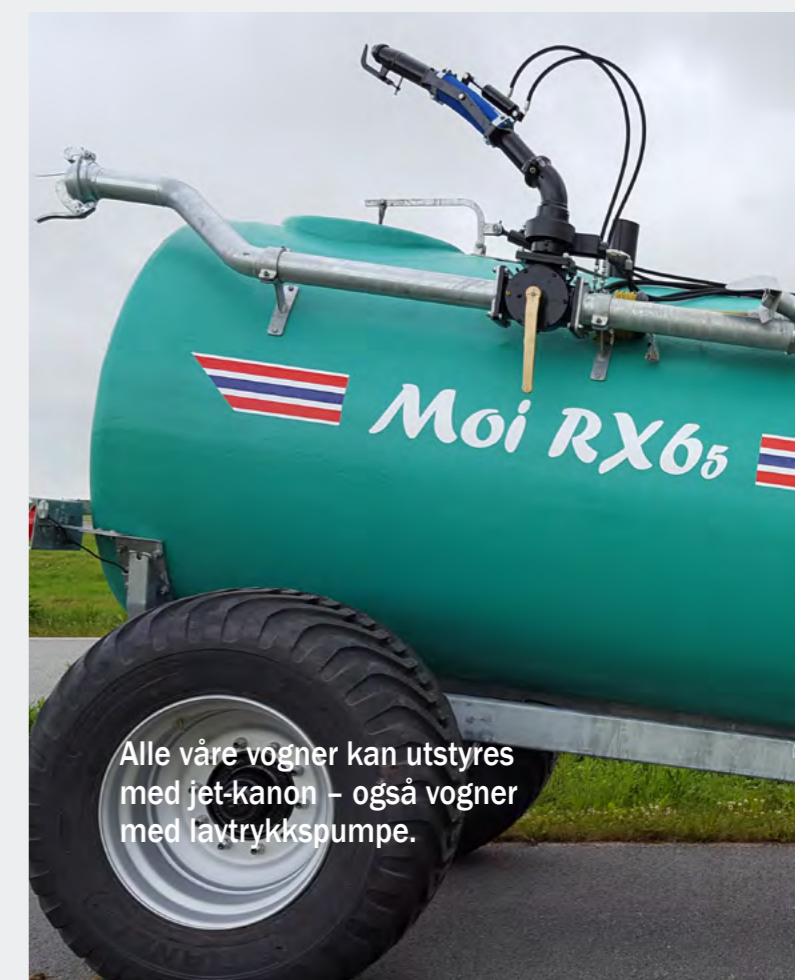
Alle våre vogner kan utstyres med jet-kanon – også vogner med lavtrykkspumpe.

Mit der langen Lebensdauer und dem guten Fahren Eigenschaften, sterben das Fiberglas MOI AS ist dafür bekannt, dass dieser Wagen seinen Beitrag leistet zur Ergänzung der breiten Auswahl an Güllewagen von MOI AS.